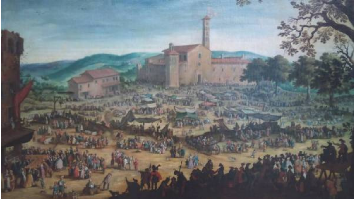
La foire d'Impruneta - Jacques Callot (1592-1635)

La semaine suivante, Nasreddine trouve une solution.