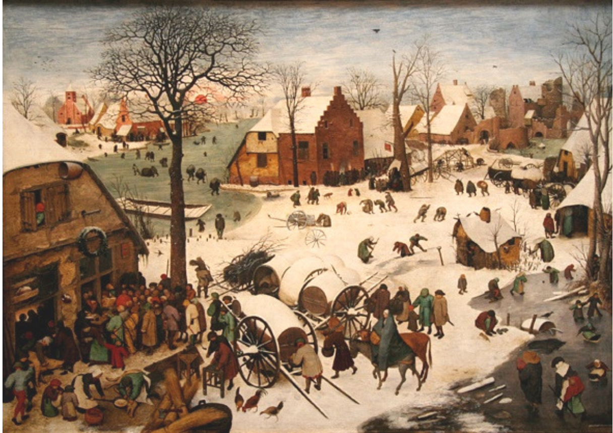
Dénombrement de Bethléem - de Pierre Bruegel l'Ancien (1527-1569)