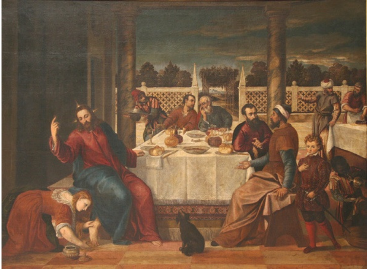
Jésus chez Simon le Pharisien - Bonifazio de Pitati, dit Veronese (1487-1553)

Les vieux messieurs se moquent de Nasreddine et Moustafa parce que tout le monde est sur l'âne.