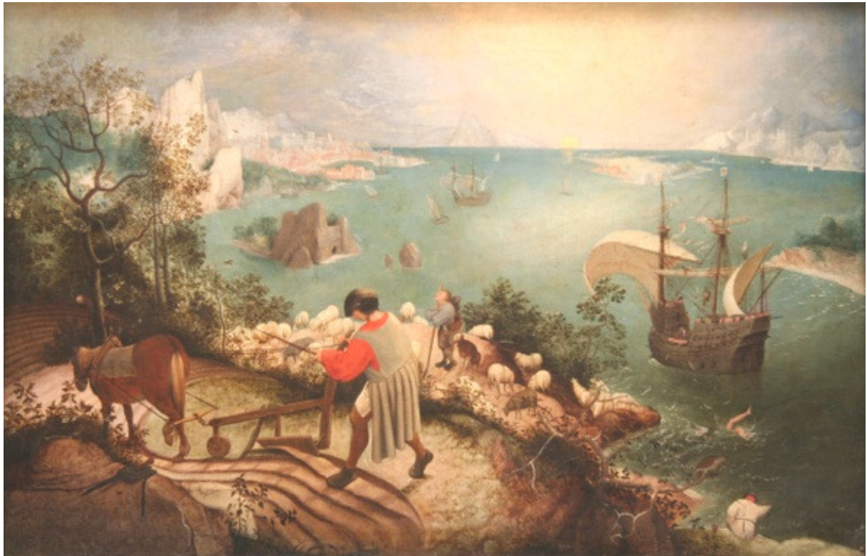
La chute d'Icare - de Pierre Bruegel l'Ancien (1527-1569)

Une semaine après, Nasreddine coupe la laine des moutons. Il ramasse la laine et la met dans un grand sac. Nasreddine fait semblant qu'il a mal à la cheville.