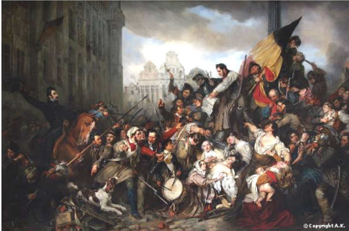
Episode des journées de septembre 1830 - de Gustave Wappers (1803 - 1874)

Nasreddine court pour attraper les poules.