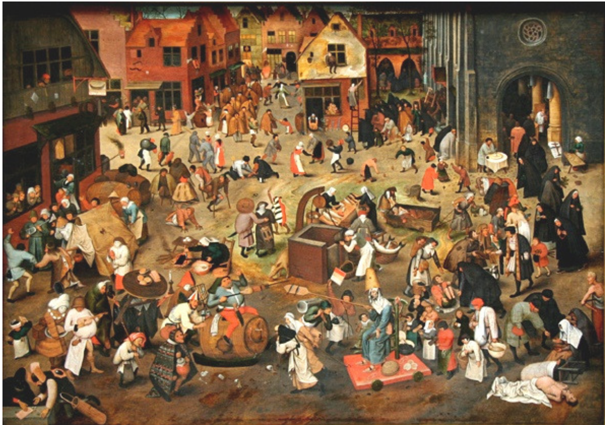
Le combat de Carnaval et Carême - Pierre Bruegel le Jeune (1564-1638)