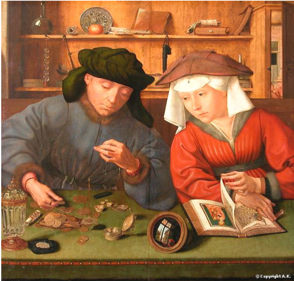
Le Banquier et sa femme - Quentin Metsys (1466-1530)

Ils arrivent au marché pour vendre les dattes.