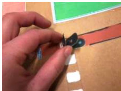
Système de changement de couleur du feu de circulation.

Tapis de circulation « fait maison », réalisé par Jean-Claude Demuyser (LEE Nivelles).